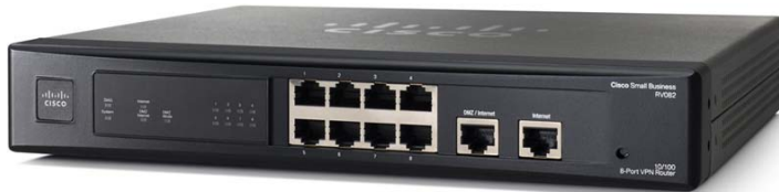
Figure 1. Routeur VPN double WAN Cisco RV082

Pour renforcer la protection de votre réseau et de vos données, le routeur Cisco RV082 comprend des fonctionnalités de sécurité professionnelles et une fonction facultative de filtrage Web basée sur le cloud. La configuration est un jeu d'enfant grâce au gestionnaire d'appareils intuitif basé sur navigateur et aux assistants de configuration.